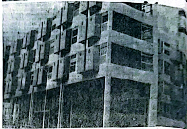
Un sector de la moderna y funcional estructura del nuevo Hospital San Martín de Paraná, —la que da sobre calle Gualeguaychú— que se inaugurarán en la capital de nuestra provincia.